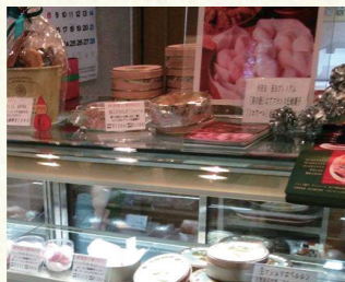
↑ショーケースの上に大きなPOPを置いてあります。とても目立ちます。