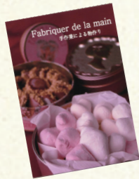
↑タマミューユさんで実際に使用しているイメージ写真です。

店内のすべての商品にPOPをつけて、作り込んだお菓子の価値をしっかりと伝える努力をされていました。また、ショップカードに人気商品の写真と言葉を添えて、たくさんのお客さまに喜ばれている商品の紹介と、オーナーの想いや姿勢を伝える工夫をされていたのがとても印象的でした。