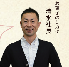
お菓子のミカワ 清水社長

「人気洋菓子店さんがしている3つのこと」というテーマでお伝えしてみましたが、いかがだったでしょうか？