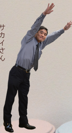
サックス & ブラウン