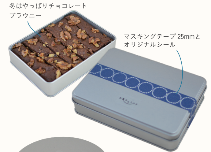
冬はやっぱりチョコレート ブラウニー マスキングテープ 25mmと オリジナルシール