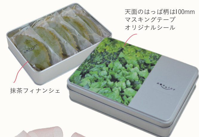
抹茶フィナンシェ 天面のはっぱ柄は100mm マスキングテープ オリジナルシール