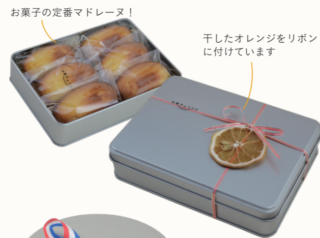
お菓子の定番マドレーヌ！ 干したオレンジをリボン に付けています