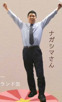
メリー ゴーランド缶