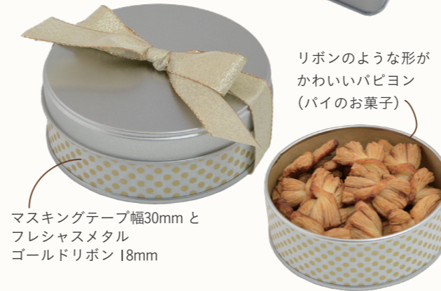
リボンのような形が かわいいパピヨン (パイのお菓子) マスキングテープ幅30mmと フレッシュメタル ゴールドリボン 18mm