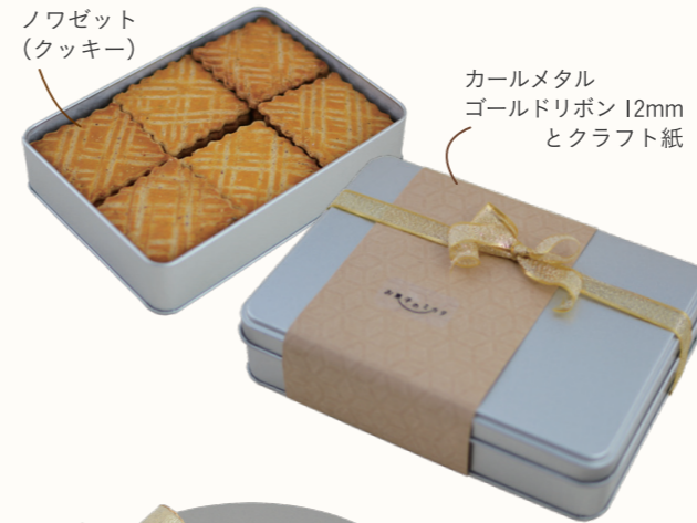
ノワゼット (クッキー) カールメタル ゴールドリボン 12mm とクラフト紙