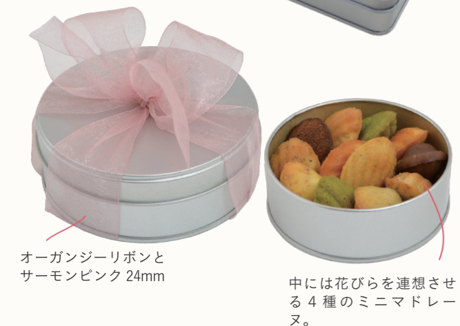
オーガンジーリボンと サーモンピンク 24mm 中には花びらを連想させ る4種のミニマドレーヌ。