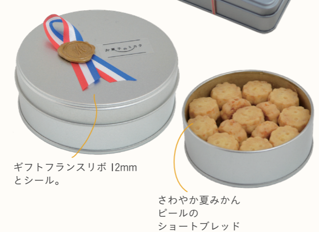
ギフトフランスリボ 12mm とシール。 さわやか夏みかん ビールの ショートブレッド