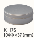
K-17S 104Φ×37 (mm)

今回はプレーン缶を使った季節のラッピングと お菓子をご紹介いたしました。 いかがだったでしょうか？