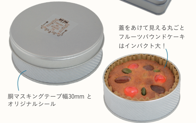
蓋をあけて見える丸ごと フルーツパウンドケーキ はインパクト大！ 胴マスキングテープ幅30mmと オリジナルシール