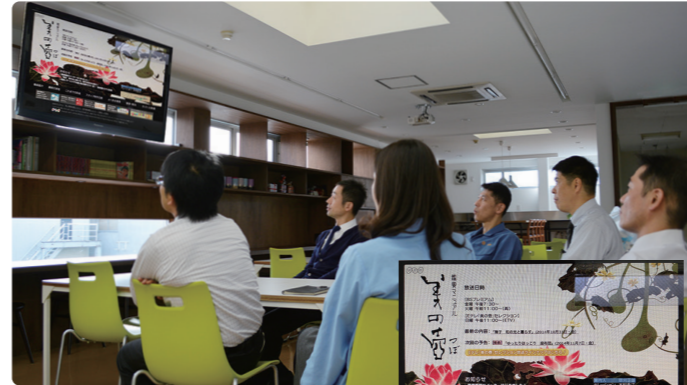
弊社食堂にて歓談中♪