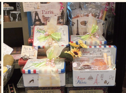
▲ラッピングが季節感を演出。夏のギフトにパリ缶いかがでしょうか？