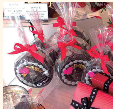
▲シヨコラ缶の中はオレンジット、バレンタインティのちよつと贅沢な自分へのプレゼント。