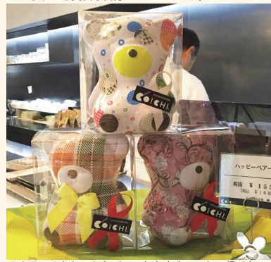
▲カラフルおしゃれなベアー缶お家までつれて帰りたい!