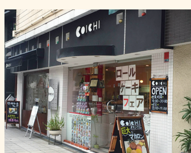
サロン・ド・テ・コイチ(真田山店)