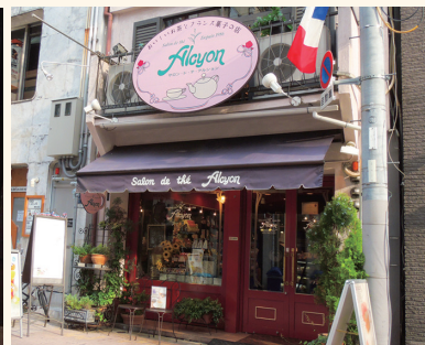
サロン・デアルシオン(法善寺店) 大阪市中央区難波1-6-20