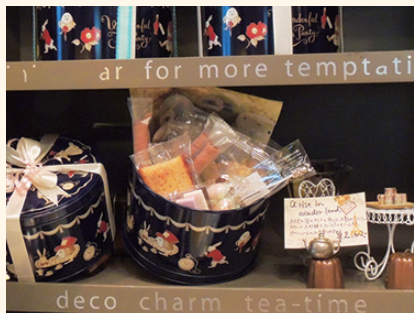
▲女子会に最適!スプーンや柄ナフキン、砂糖も入ったワンダーランドギフト。

そうですね、中身面白くしました。女性スタッフと話してちよつとかわつたものを入れようかと。柄のナフキンと、この砂糖と（リボンの形をした砂糖を見ながら）ただ、面白くすぎるとどうしても…なところはありますね（笑）中身をクッキー類で詰めてあげたほうが動くのかなって感じます。なかなか、狙い通りにいかないところはありますね。